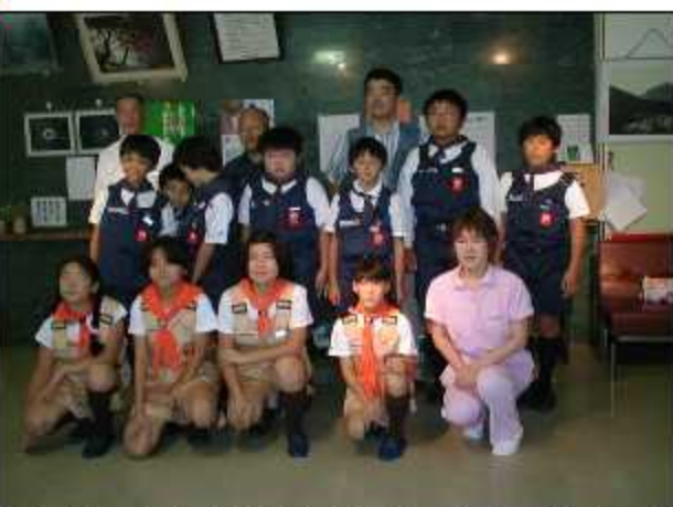
9月27日に奥多摩消防少年団（14名）の皆さんが施設を訪問されました。

奥多摩消防少年団の子供達11名と付添いの方3名が、手作りのティッシュケースと鉢植えのきれいな花を持って来苑されました。二階・三階と利用者全員の居室を回り、声かけをしたり一緒に写真に納まったりと短い時間で写真が納まったりと短い時間でしたが、楽しい一時を過ごす事ができました。