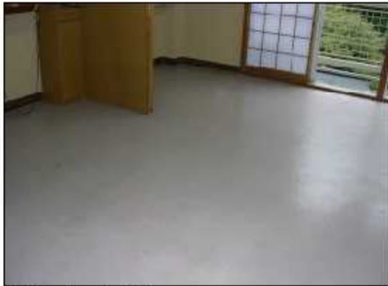
清掃の終わった居室