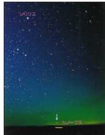
冬の宵の南の地平線低く見えるカノプス

私を含め読者の皆さんが直接この星を見る機会は少ないので、写真を供覧する。そして戦争後、私が毎日中国で捕虜の間中眺めて吉兆を得たとし、これを皆様におわちしたい。