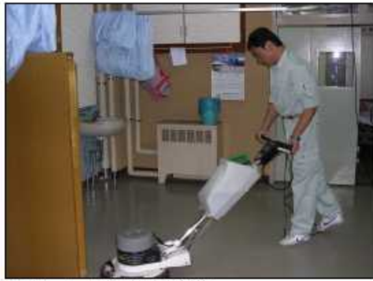
業者による機械での清掃